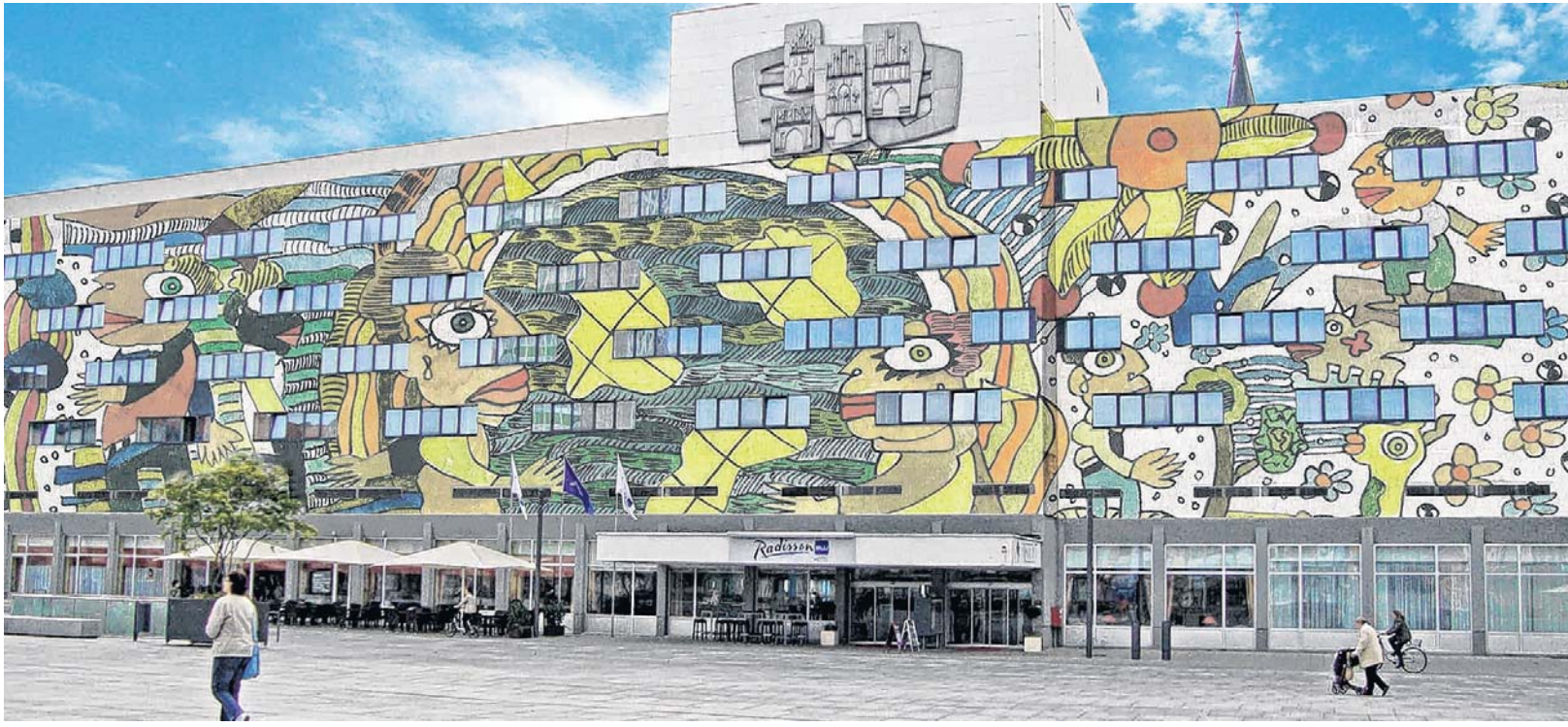
Das Radisson blu Hotel besticht bislang durch seine graue Fassade. Dabei gibt es neue Ideen, wie es anders aussehen könnte.