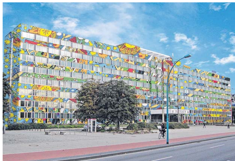
Das Neubrandenburger Rathaus in der Vorstellung des Künstlers. So ein farbenfrohes Rathaus hätte nicht jede deutsche Stadt ...